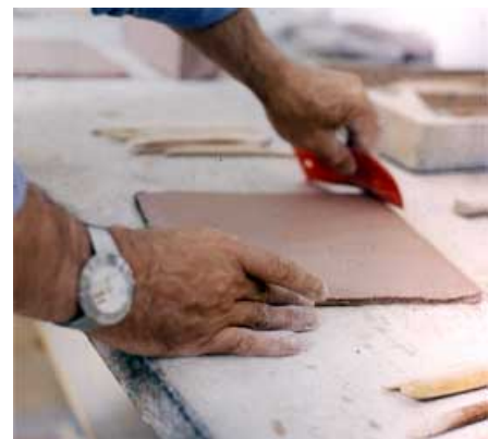
arbeiten mit Ton