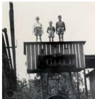
...hoch oben mit Bruder Bubi und Günther 1960 in Ostpreußen auf dem Brunnenbauerhof