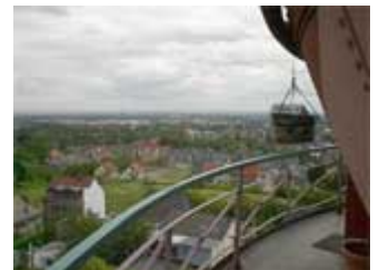
Der Fotografenkoffer hoch über den Dächern am Ziel angekommen