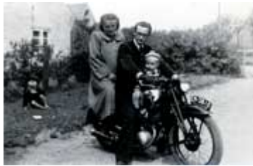
Mutter, Vater, erstes Kind 1953 in Ostpreußen

Galerien und Museen reißen sich um seine Präsenz. Viel Wirbel entsteht um den Mann, der aufgrund seiner Vielseitigkeit Anfang der siebziger Jahre als „Chaot“ gilt. „Damals war ein guter Künstler jener, der sich auf eine Stilrichtung spezialisierte, wie zum Beispiel Öker, der immer nur Nägel in Bretter klopfte, das jedoch meisterhaft“, erinnert sich Erdtmann. Ausstellen lassen will er sich nur als „ganzer Künstler“ - mit all seinen Talenten. Mit Skulpturen, Kollagen, Bildern in Öl und anderen Facetten. Für Ausstellungen nur mit Malerei oder nur mit Bildhauerei, wie es Kunstpápste verlangen, um ihn einzuordnen, ist er nicht zu haben – das ist dem Multitalent nicht genug.