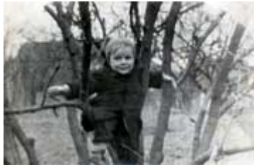
...hoch klettern musste er schon in frühen Jahren