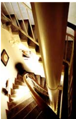
Der Weg nach oben (Treppenhaus im Turm)