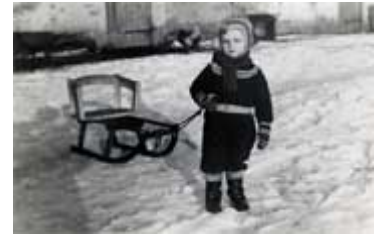
...im Masurischen Winter auf dem Bauernhof 1954