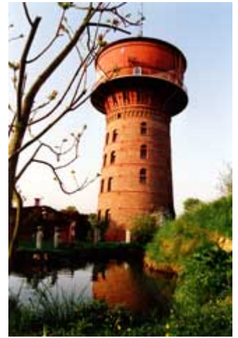
Das Atelier oben in der Stahlkugel