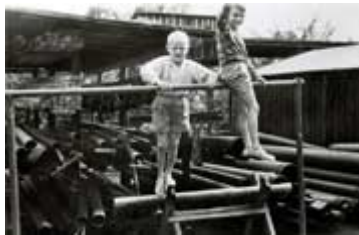
...mit dem Bruder "Bubi" auf dem Brunnenbauerhof